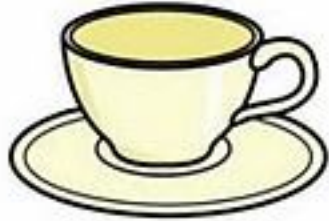
TAZA DE CAFÉ