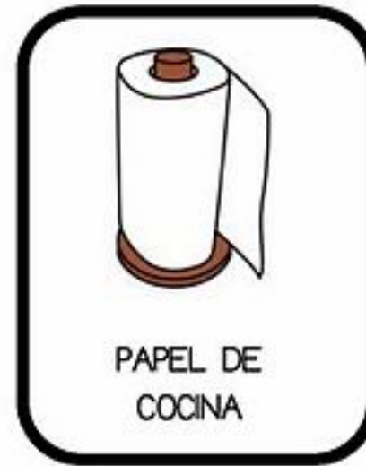
PAPEL DE COCINA