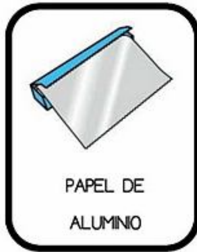
PAPEL DE ALUMINIO